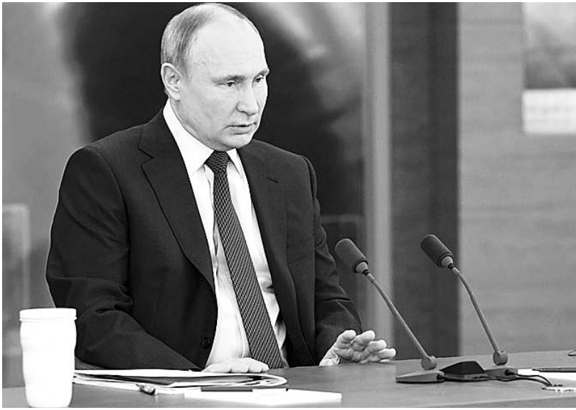
Начало темы в субботнем номере от 19 декабря на 1-й стр.